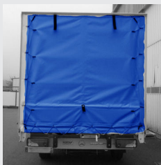
Fermeture arrière par bâche, en option