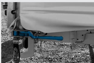
Tension de la bâche par cliquet