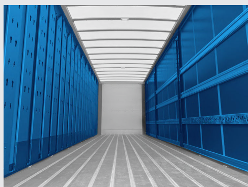
Configuration Eurolib - Openbox